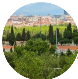
PARQUE DE LA CUÑA VERDE