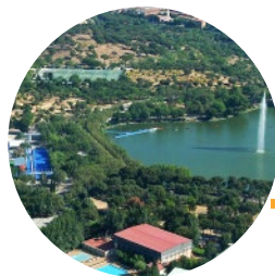
CASA DE CAMPO