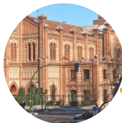
BARRIO DE LATINA

Y, para aquellos que buscan tranquilidad y estar en contacto con la naturaleza; la ubicación de Residencial FA17 es perfecta ya que se sitúa a escasos minutos de varios parques icónicos de Madrid como son la Casa de Campo, Madrid Río y Parque de la Cuña Verde, tres grandes pilares que conforman el pulmón verde más importante de la ciudad.