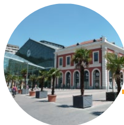
PALACIO REAL - PRÍNCIPE PÍO